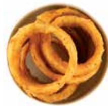
حلقات البصل 6 نصف الكمية