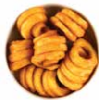
بطاطس كيرلي 5